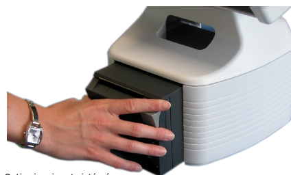
Option imprimante intégrée EPSON® TM-T70