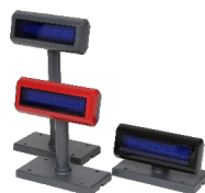
Afficheurs déportés en option

Vous définissez l'ensemble de votre configuration parmi l'éventail de coloris et les différentes options. Nous le préparons pour vous ! Les tests et la mise en place de la personnalisation est réalisée en France par nos services techniques. Cette finition française est le gage qualité de votre terminal tactile.