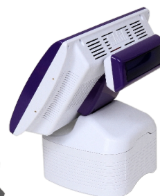
Système SAGA Blanc glacier