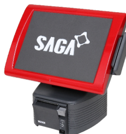
Système 15" lecteur magnétique intégré